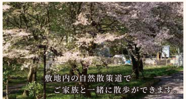
敷地内の自然散策道で ご家族と一緒に散歩ができます。