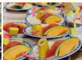
おたのしみイベント