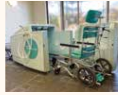
浴室 (ミストシャワー)