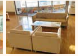
ご家族 談話コーナー