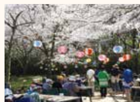
行事 (敷地内でのお花見)

天気が良ければ、敷地内でご家族様と一緒に自然 の風に当たりながらのんびりと過ごせる環境です。 季節ごとの行事には、地域の高校生やボランティア の参加もあり楽しい時間を過ごします。